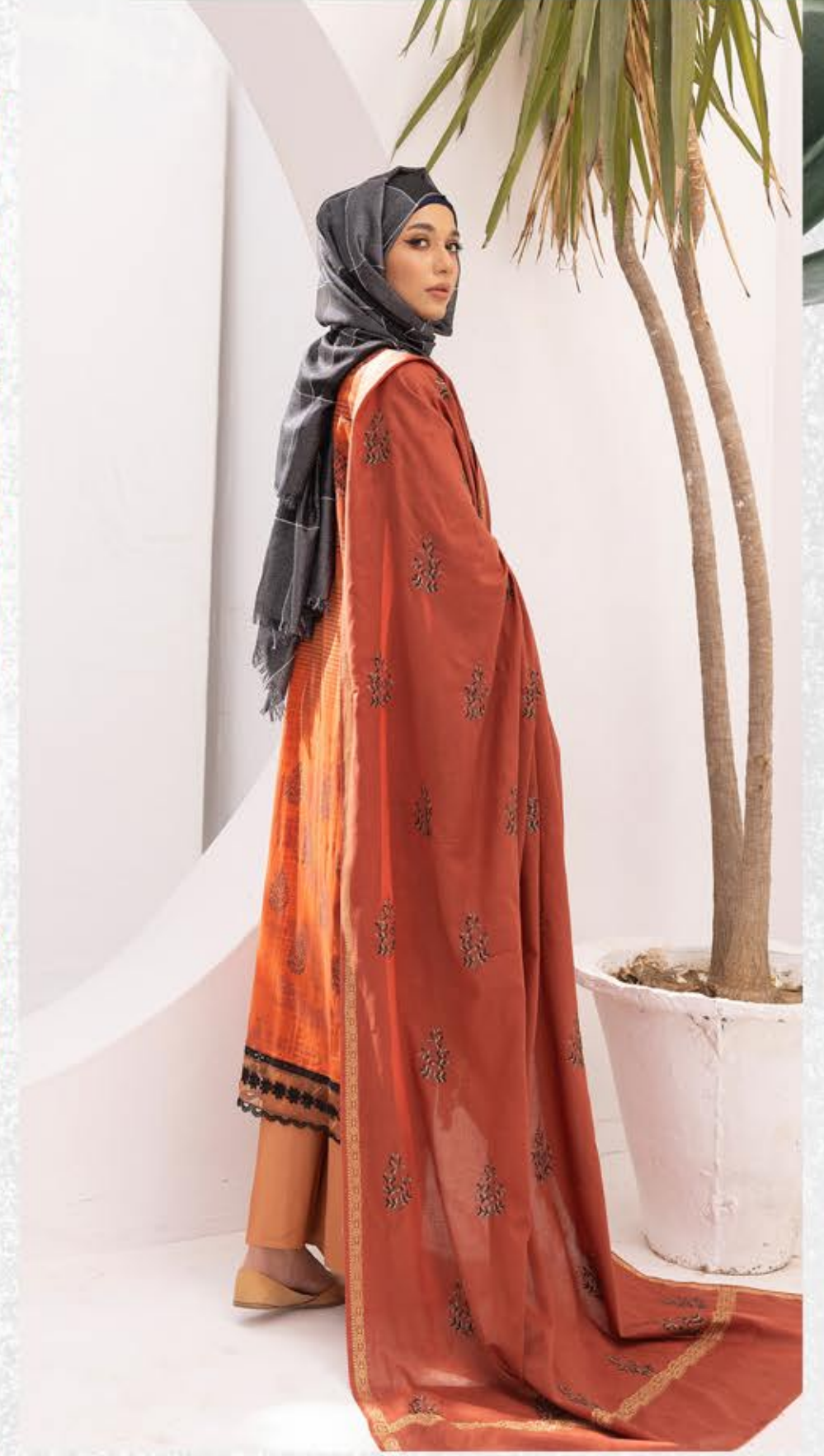
فرنٹ اور بازو پر دستی آری مشین کیساتھ زری سے پرنٹ کیمطابق آؤٹ لائن اور پھر ایمپرائیڈری میں دستکاری شیشوں کا کام جیکارڈ فینسی دوپٹے میں دھاگہ اور زری سے پرنٹ کیمطابق ایمپرائیڈری بوٹیوں کا چھتہ